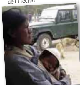
• Mamá Wichi y su bebé.