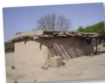
• Choza de adobe y paja.