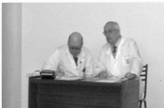
• 4 de septiembre de 2008. Sesión del Claustro Plenario para la elección de nuevas autoridades.