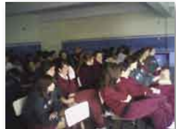
• Colegio Verbo Encarnado