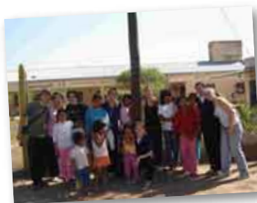
• Llegada al Paraje Tres Lagunas.