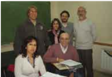
• Integrantes del AVAS ROSARIO.