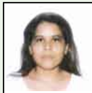
Barquero Ven - Cirugía General -