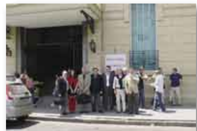
• Delegación del IUNIR frente al Hospital Cullen.