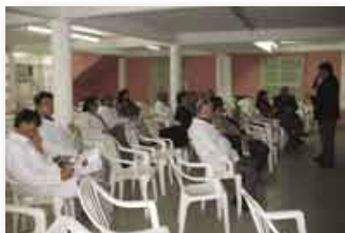
• Presentación carreras de postgrado a los Jefes de Servicio del Hospital.

De esta manera, el IUNIR continúa extendiéndose y afianzándose en las ciudades y localidades próximas a Rosario.