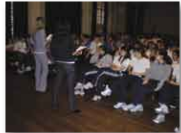
• Colegio Dante Alighieri