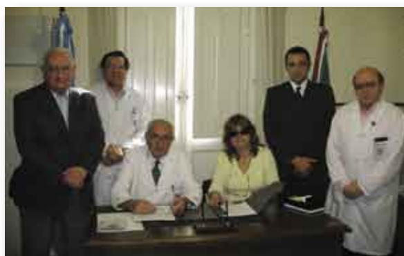
• Autoridades del IUNIR y de la UADER