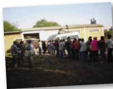
• Paraje 10 de Mayo