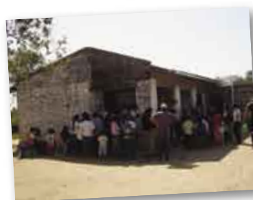
• Centro de Salud del Paraje Tres Lagunas.