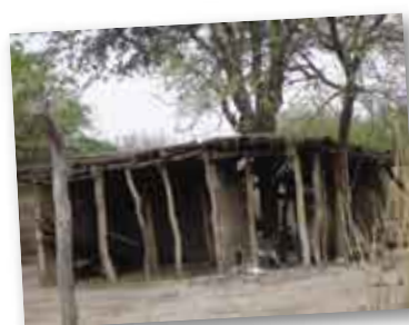
• Paraje Los Acostas.