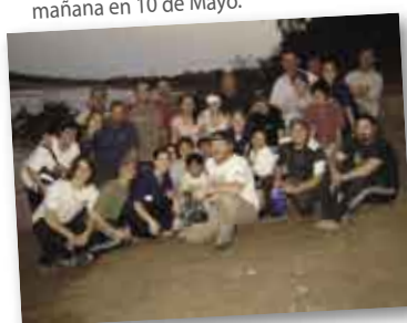
• Voluntarios a la orilla del Río Bermejo.