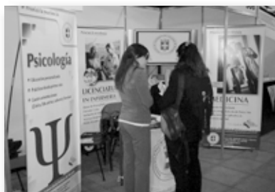
Feria Patio de la Madera

Del 3 al 5 de Septiembre se llevó a cabo en las instalaciones del Patio de la Madera, la 13° Expo Carreras Rosario 2008. En esta edición participaron más de 25.000 jóvenes quienes llegaron al lugar en búsqueda de información sobre la oferta académica de la ciudad. El IUNIR se hizo presente junto con otras instituciones educativas, no sólo de nivel universitario, sino también terciarias, de oficio y de idiomas.