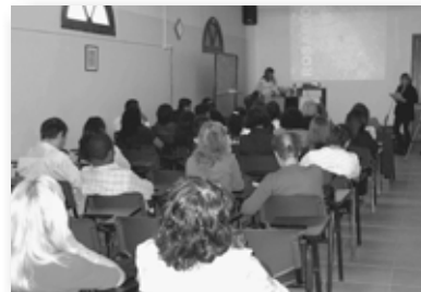
Acto Inicio 4º Curso Inmunoematología