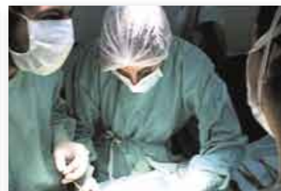
• Alumnos 4to año en Cirugía del Sanatorio Británico de Rosario