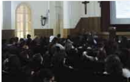
• Colegio Nuestra Señora del Huerto