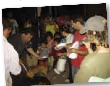
• Compartiendo la cena con los habitantes de El Techat.