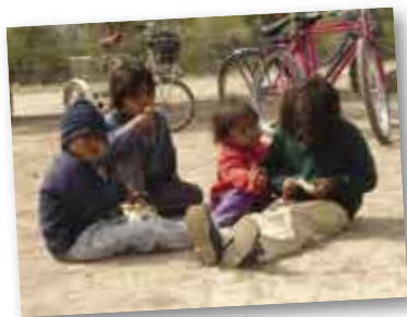
• Niños jugando en El Techat