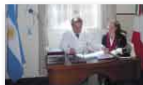
Firma del Convenio Especifico entre el IUNIR y la UCL.

Desde hace más de 40 años, una empresa argentina investiga, desarrolla y produce, bajo los más rigurosos estándares de calidad, la más completa línea de reactivos y sistemas para el Diagnóstico Clínico. Desde Rosario, Argentina, y para el mundo en una tarea ética que se renueva cada día.