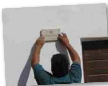
• Placa del IUNIR en el Paraje Pozo del Algarrobo.