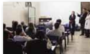
Los profesores belgas explicaron los programas de intercambios a la comunidad del IUNIR.