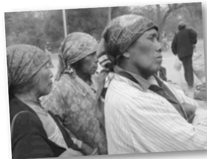
• Mujeres Wichis a la espera del bolsón de alimentos y ropa.

El IUNIR felicita a sus alumnas por su labor y agradece a la Fundación el darnos anualmente esta oportunidad única de reforzar nuestro compromiso con la comunidad.