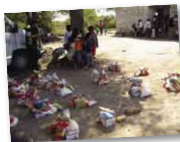
• Distribuyendo la ayuda.