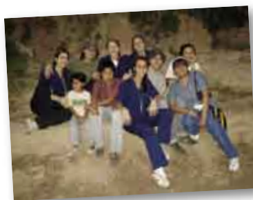
• El equipo de trabajo del IUNIR.