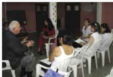
• Reunión con Jefas de los Departamentos de Enfermería.