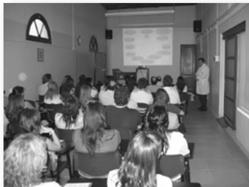
Padres y estudiantes escucharon atentos la oferta académica del IUNIR

Ya concluido el ciclo de charlas, sigue abierta la inscripción a los cursos de ingreso a desarrollarse en febrero de 2009.