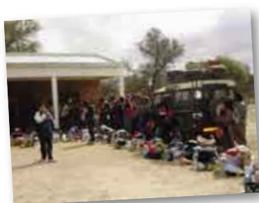
• Bolsos con ropa, alimentos y juguetes.