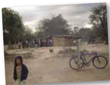
• Paraje El Techat.