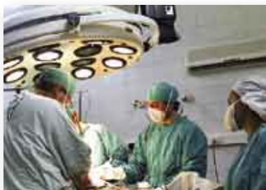
• Hospital Italiano de Monte Buey