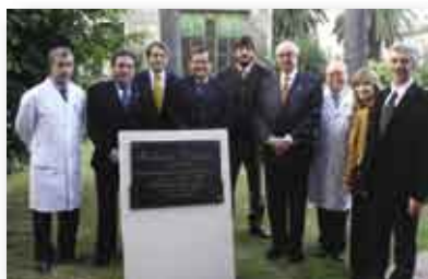
• Autoridades del IUNIR y del HIG junto al Cónsul de Italia y al Agregado Científico de la Embajada de Italia.

En una visita a la ciudad de Nápoles, contrajo fiebre tifoidea al asistir enfermos, muriendo en 1900.