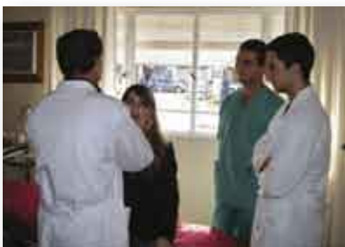
• Sanatorio Modelo de Rufino

en esta entrega se expone lo realizado este 2008 en el Sanatorio Modelo de Rufino, Hospital Italiano de Monte Buey y Sanatorio Británico.