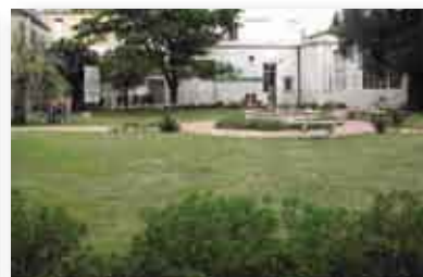
• Plazoleta Giovanni Carcano.