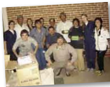
• El equipo de salud luego de una larga mañana en 10 de Mayo.